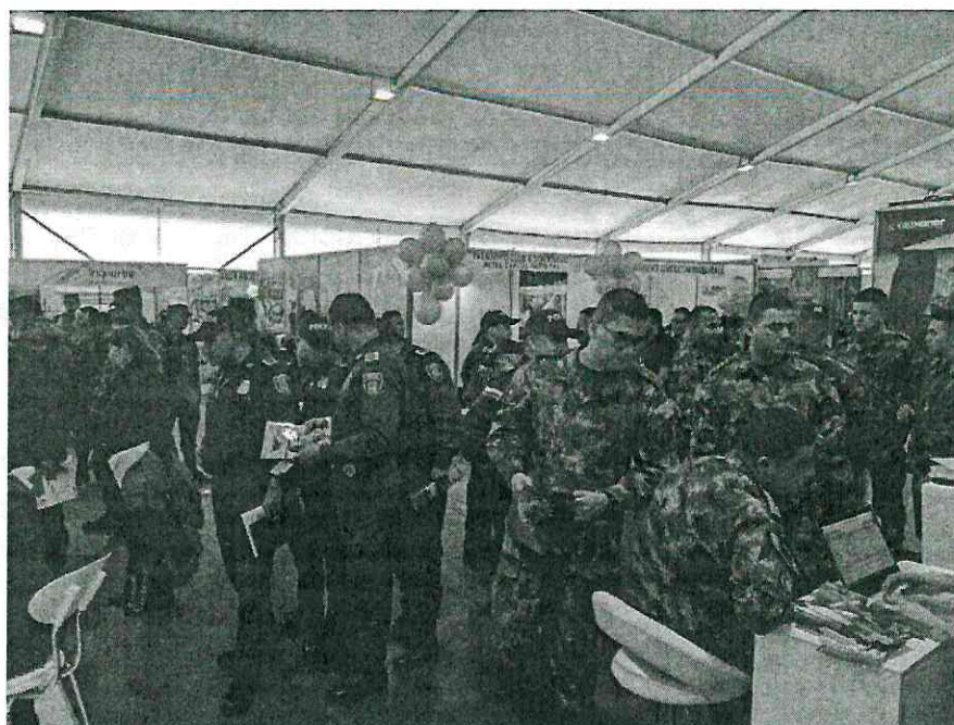
Imagen 2. Fotografías XX Feria Inmobiliaria Caja Honor.